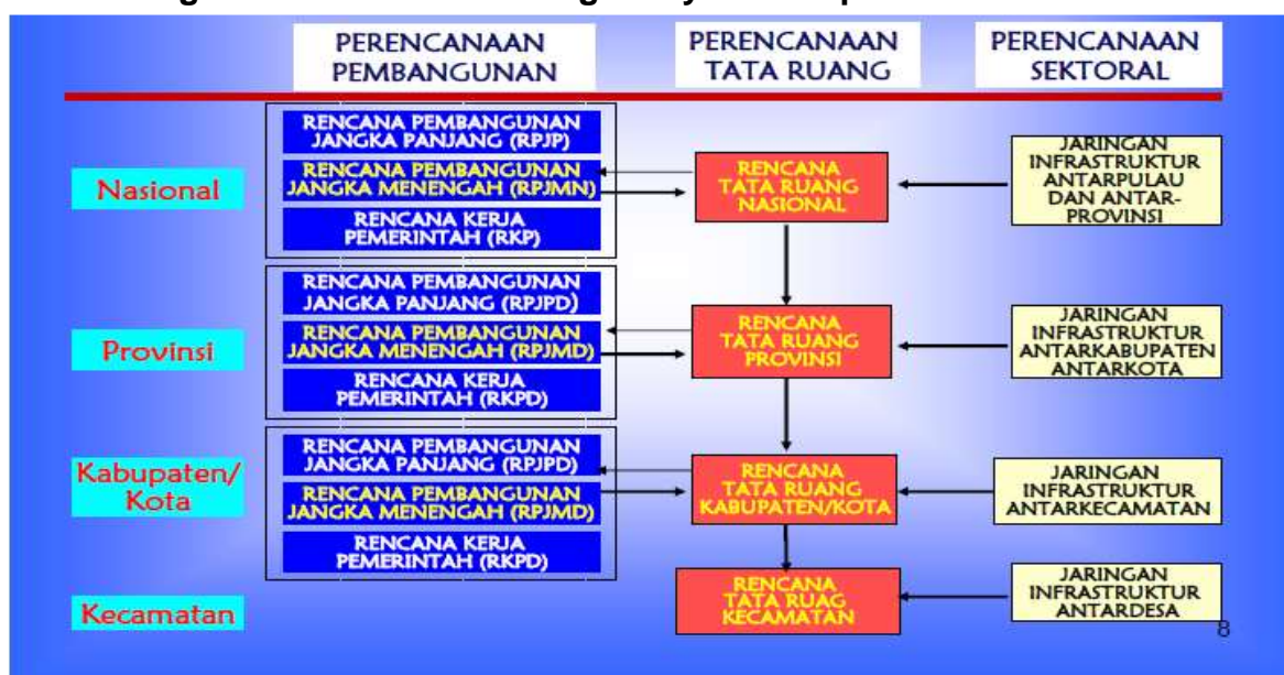
Gambar 1.2 Hubungan Rencana Strategis Kecamatan Muara Kelingi Dengan Rencana Tata Ruang Wilayah Kabupaten Musi Rawas

Berikut adalah hubungan Rencana Strategis Kecamatan Muara Kelingi periode tahun 2016-2021 dengan Rencana Tata Ruang Wilayah Kabupaten Musi Rawas.